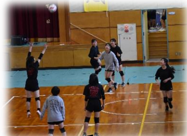
息の合ったトスラリー!