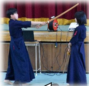
ビシッと決まった面!