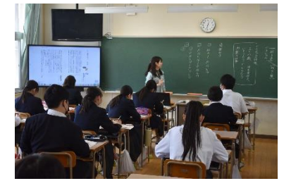
真剣に先生の話聞く様子