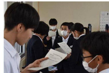
英語で友達と対話する様子