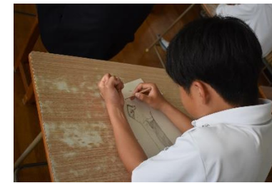
自分の手をデッサンする様子