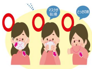
マスクの着用・咳エチケット