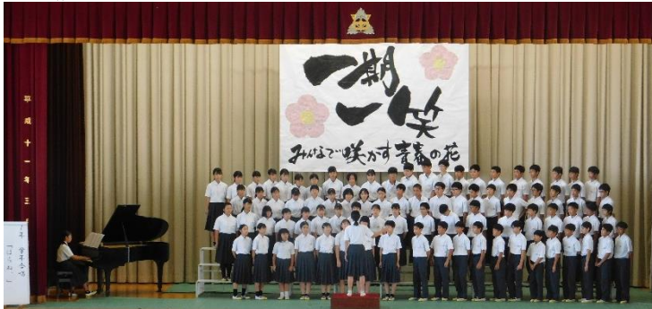
1年学年合唱「ほらね、」