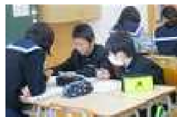
互いの見方・考え方を交流し合う生徒たち。

それぞれの公開授業の中で生徒たちは、資料に基づき知ったこと、考えたこと等を学友と交流し、自分の知識と比べたり、関連付けたりしながら、活気ある雰囲気の中で学習を進めていました。