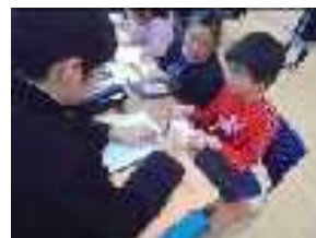
先生役の生徒からの「What's your name?」「How do you spell?」等の問いかけに英語で答える児童たち。

「C-L Time」は「Co-Learning Time」の略で、「異学年による交流学习の時間」という意味です。具体的には、中学部の生徒が先生役となり小学部の児童に学習の支援等を行う異学年交流学习です。今回、英語学習の「C-L Time」を行いました。交流学年は8年生と5年生です。この学習では、8年生が英語による自己紹介の手本を示し、その後、8年生の支援を受けながら、5年生も英語で自己紹介ができるようになっていく学習活動を行いました。