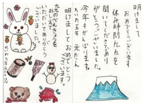
児童から届いた年賀状の一例