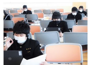
身振り手振りを加えながら九九の指導を行う生徒たち