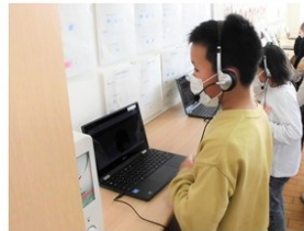
タブレット端末の画面に向かって九九を暗唱する児童たち

本年度の取組後、2年生の全児童たちから「九九をきいてくれて、ありがとうございます。とてもたのしかったです。」「くくボランティアのおかげで、くくをまちがえなくなりました。ありがとうございます。」などの感謝の言葉が綴られたメッセージ・カードが送られました。更に今年の正月、2年生の全児童たちから沢山の感謝の年賀状が届きました。