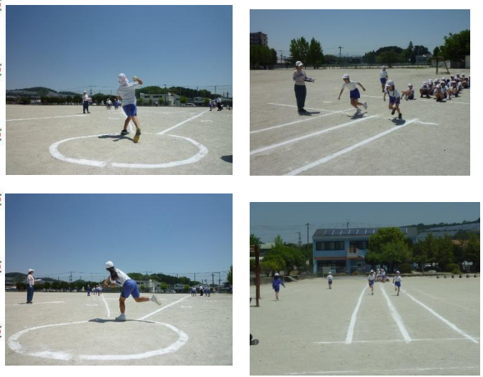
新体カテスト測定が始まりました。教室ではエアコンが入りました。(写真は4年1組さんと2組さんです)