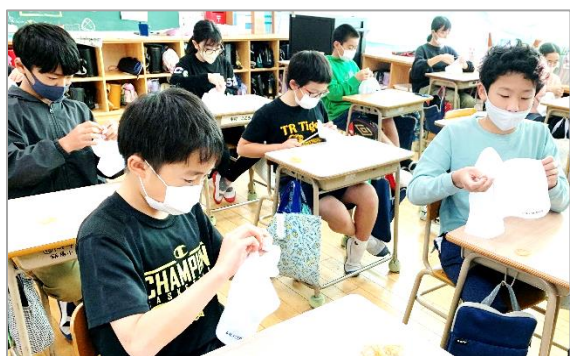
<絞りの模様づくり>

来年度入学する新1年生に茜染めのハンカチをプレゼントするため、12月13日、5年生が茜染めに挑戦しました。プレゼントするハンカチ等の材料は飯塚・片島まちづくり協議会から準備していただき、染め方のご指導もしていただきました。