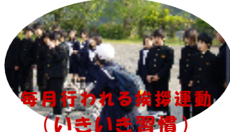
毎月行われる挨拶運動 (いきいき習慣)