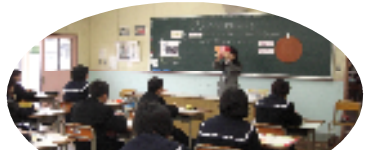
教材・指導方法の工夫で 学力向上を目指します！