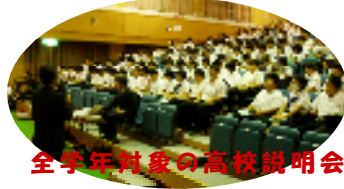
全学年対象の高校説明会