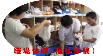
職場体験(福祉体験)