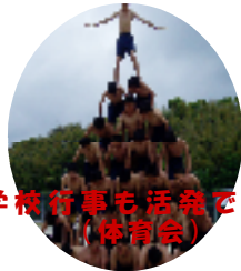
学校行事も活発です！ (体育会)