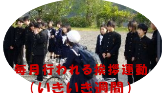
毎月行われる拵拵運動 (いきいき週間)