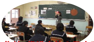
教材・指導方法の工夫で 学力向上を目指します！