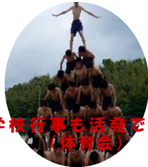
学校行事も活発です！ (体育会)