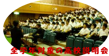
全学年対象の高校説明会