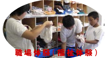
職場体験(福祉体験)