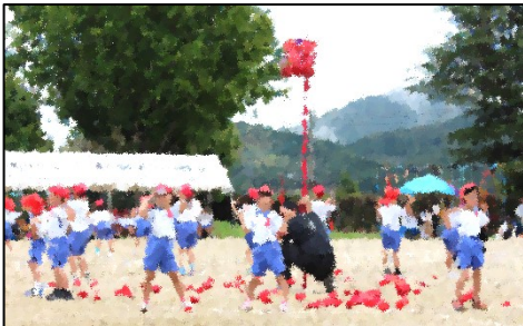
【1・2年生 チェッコリ玉入れ】

今年の上穂波小学校の運動会のスローガン『エンジン全開でみんなが輝ける運動会にしよう!』のとおり、ひとり一人が輝いた素晴らしい運動会でした。たくさんの応援をありがとうございました。