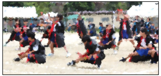
【3・4年生 よさこいソーラン】