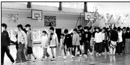
【歓迎集会1年生入場】

また、当日は「弁当の日」の取組も行われ、早起きして作ったお弁当を嬉しそうに見せ合う姿も見られました。保護者の皆様には、朝早くからご準備いただきありがとうございました。