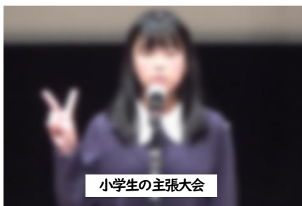
小学生の主張大会

出場した3人は、練習を積み重ねたり、話す内容を練り直したりして本番に臨みました。当日は、ステージに立ち、多くの聴衆の前で発表するのは、とても緊張するものですが、どの子も堂々と発表することができました。小学校では他校児童と関わる機会はありません。今回この貴重な経験を今後に生かしてほしいと思います。