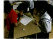
【ステップアップタイム】

中学部の教員が1年間を通して、小学部に教科指導を行う「乗入れ授業」を実施します。今年度は、6年生の音楽科で実施しています。また、小学部の各教科で中学部の教員が専門的な教科指導を行う「出前授業」を実施しています。道徳科の授業では、小学部の授業で中学部の教員が数十分程度で行う「フアンポイント出前授業」にも取り組んでいます。