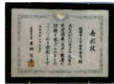
【キャリア教育文部科学大臣表彰】