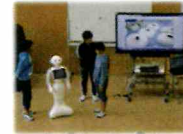
【プログラミング学習】

ソフトバンクロボティクス株式会社から無償貸与された人型ロボット「Pepper」を活用した、プログラミング教育を行っています。