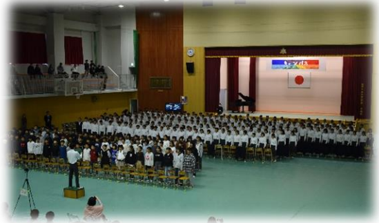
【全校合唱による「花は咲く」の合唱場面】

10月31日に、文化祭を行いました。生徒会を中心に企画・運営を行いました。プログラムとして、「少年の主張」「英語スピーチ」「放送部の発表」「合唱コンクール」「マイク越しの本音」「音楽部の発表」があり、展示作品として、「国語科作品」「家庭科部作品」「そよかぜ作品」「なのはな作品」「こすもす作品」「国語作品」「英作文」「本の紹介カード」がありました。どの作品やステージ発表も優れていて、文化の薫る、素晴らしい一日でした。来校された関係者の皆さま、保護者の皆さま、参観ありがとうございました。