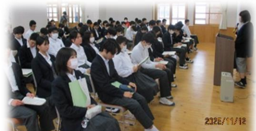
【進路説明会の風景】

11月12日に、9年生とその保護者を対象に、第2回進路説明会を行いました。数年前から公立高校では特色化選抜入試が導入され、今年度から公立入試の申込み WEB 出願システムを利用するようになりました。説明の中では、入試の日程や、各公立校の特色化選抜や推薦入試の募集人数、内定基準、特色化選抜と推薦入試を併願できないこと、私立高校の専願入試や推薦入試は、必ずその高校へ進学することが条件であることなど、細かな確認を行いました。