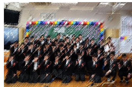
【集合写真9年1組(上)、9年2組(下)】