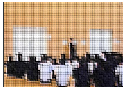
【集会でキャプテンが話す場面】

4月20日の放課後に、部活動生集会を行いました。各部のキャプテンや部長が事前に集まって、部活動生集会の企画・運営を行いました。キャプテン会で役割を分担し、整列指導、司会、はじめの挨拶、終わりの挨拶など行いました。このような機会を経験するのは、素晴らしいことだと思います。