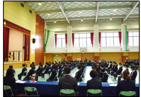
【第10回中学部入学式】

そして皆さんが仲間と共に、互いの個性を生かし合い、励まし合って生きていく姿が校歌の歌詞にもある「幸せの学び舎」で見られるよう、先生方一同でしっかりサポートしたいと思います。”