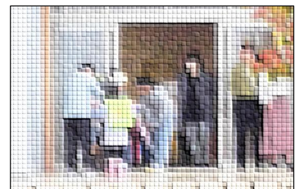
【新1年生とあいさつを交わす場面】

小学部のある先生が、児童が先に挨拶をした際に、「すごい。先に、さわやかな挨拶ができていますね」と称賛の声掛けをされていました。中学部の先生も、中学部の生徒が、高校や社会に出たときに、自分からあいさつすることで周りの人から好感をもたれ愛される大人になれるよう後押ししていきたいと思っています。参考までに、校内に掲示している「あいさつスタンダード」を記載しておきます。