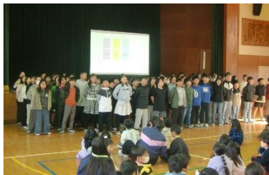
【5年生の歓迎セレモニー】