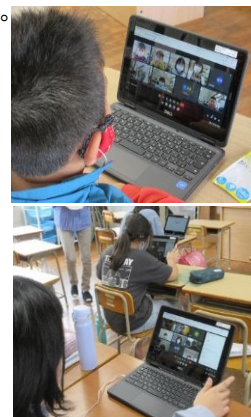
(上) 2年生のクラス (下) 4・5・6年生の各クラス