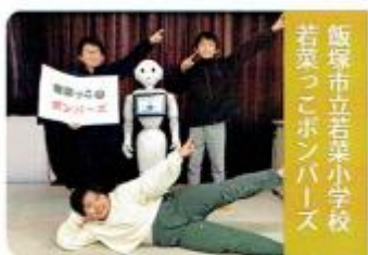
SDGsで未来を守ろう～ 若菜小学校クリーンアップ大作戦 Pepp

本年度、5年生の4名が飯塚市のプログラミングコンテストに参加し、見事優勝しました。その成果を「STREAM チャレンジ」に応募していたところ、先日プリントを配付いたしましたが、全国で10位以内に入ることができました。その最終結果の発表が、12日(日)13:00からYouTubeでオンライン配信されます。本校「若菜っ子ボンバーズ」の発表は、14:30頃～、結果発表・表彰は15:25頃～配信される予定になっています。PC・タブレット・スマホなどで見るができますので、ぜひ応援をお願いします。