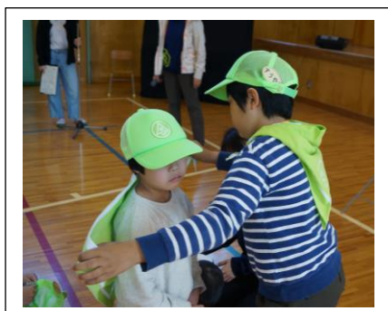
緑のスカーフを巻く様子

4月19日（金）の歓迎集会の前に「緑の少年団」「日本赤十字」の入団式を行い、上学年が1年生に緑の帽子とスカーフを渡しました。その後の歓迎集会では、各学年より1年生に歓迎の言葉を伝えたり、プレゼントを渡したり、児童会の子ども達を中心に考えた遊びをしたりしてみんなで楽しみました。その中で1年生に優しくスカーフを掛けてあげたり、インタビューに困る1年生を助けてあげたりする上学年の優しい姿が随所に見られるとても心温まる集会となりました。集会後、遠足で「ピクニカ共和国」へ行きました。ここでもかわいい動物たちと過ごし、笑顔かがやく楽しい遠足となりました。