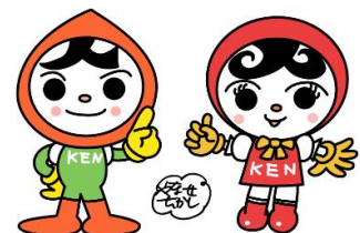
法務省人権イメージキャラクター 人KENまもる君(左)と人KENあゆみちゃん(右)

ご家庭でも、お子さんの言動に気を配って頂き、相手を傷つける言動が見受けられたらその都度ご指導くださいますようお願いいたします。