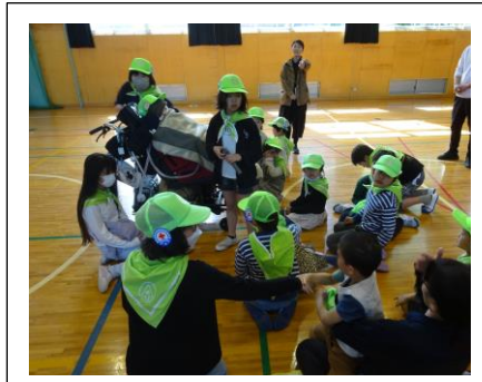
リーダーの言った人数で集まるゲームの様子