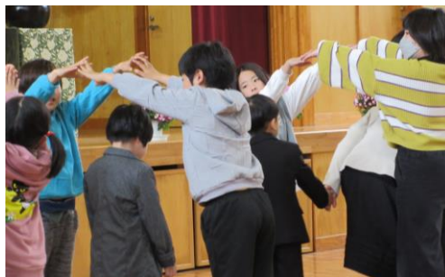
式の中で「さんぽ」の曲に合わせてトンネルを作ったり、歩いたりしている様子です

少し緊張した新1年生を5・6年生が中心となり在校生が振り付けをして相撲大会などの学校行事を紹介したり、「さんぽ」を歌ったりして歓迎しました。新1年生も保護者の方にも大変喜んでいただけました。後輩のために、がんばれる在校生の優しさがとてもうれしく思いました。