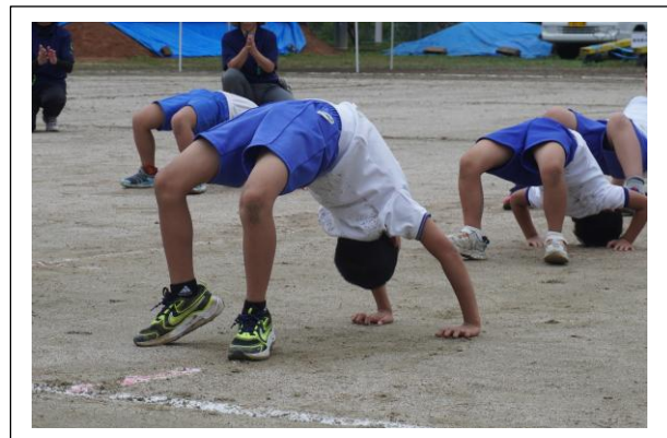
（ 全児童の力強いブリッジの様子 ）