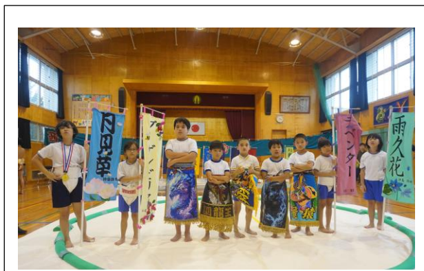
( 八木山っ子の力士たち )

その応援に応え、八木山っ子も体力差のある子や異学年の子にも果敢に挑み、一生懸命がんばることができました。高学年女子の取組では、相撲教室の子を破り、八木山っ子の6年生が優勝しました！子ども達のがんばりは、最高でした。参加した子ども達みんなが、相撲の楽しさを味わうことができました。