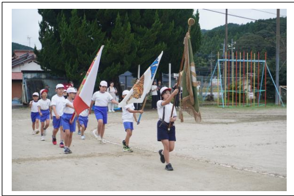
（ 入場行進の様子 ）